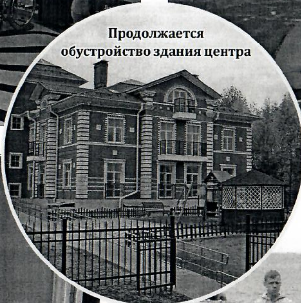
Продолжается обустройство здания центра