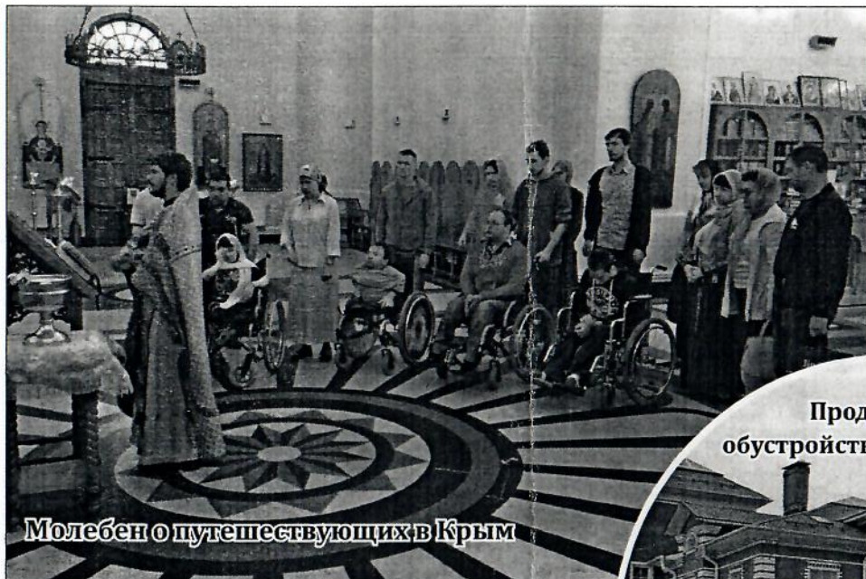
Молебен о путешественниках в Крым