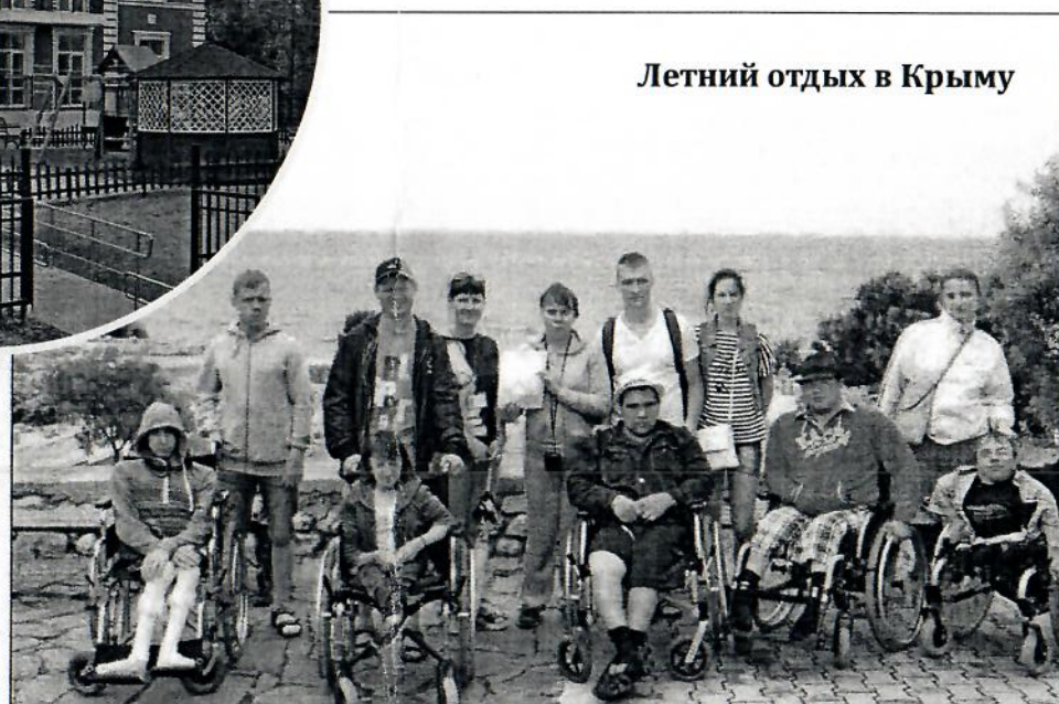
Летний отдых в Крыму