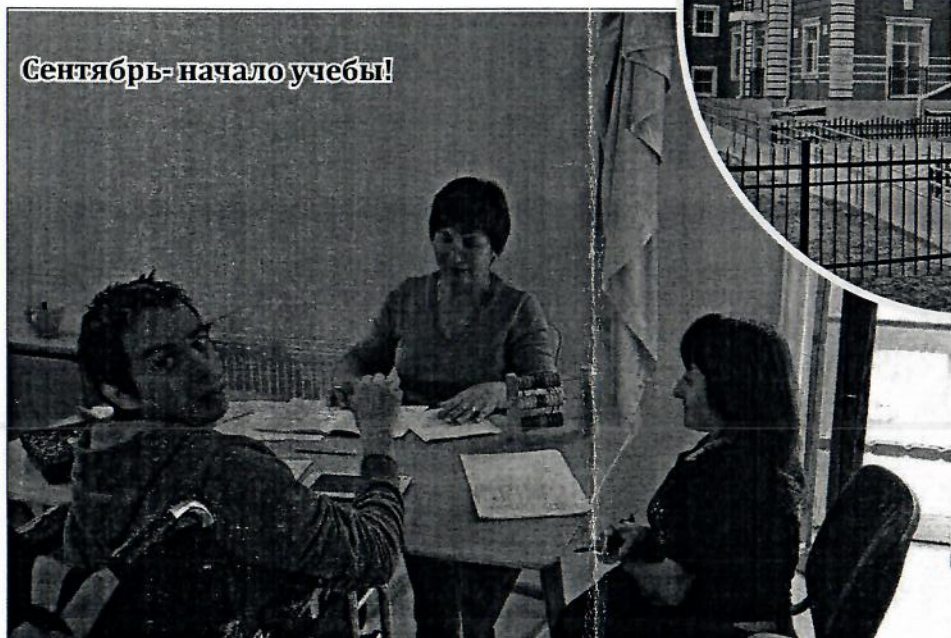
Сентябрь- начало учебы!